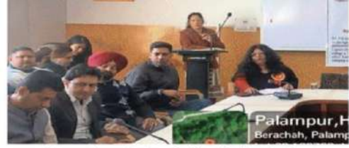
पालमपुर में मंगलवार को शुरू हुई कार्यशाला में उपस्थित प्रतिभागी व अतिथियों का शुभारंभ